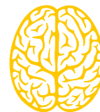
Gehirn eines Erwachsenen 1,45 kg